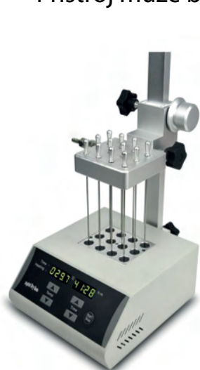
HMINDK200-1NP za 21 400 Kč bez DPH

Koncentrátor LabEva je určen pro zakoncentrování vzorků. Odpařování je zajišťováno ohřevem vzorků a odfoukáváním rozpouštědla proudem inertního plynu popř. vzduchu. Přístroj může být využit také pouze pro ohřev vzorků.