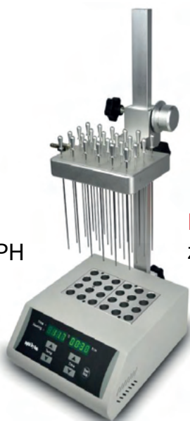
Model se dvěma hliníkovými bloky (HMINDK200-2N) za 26 500 Kč bez DPH

Model s jedním hliníkovým blokem (HMIMINI-100N) za 11 975 Kč bez DPH