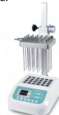
HMINDK200-2NP za 23 900 Kč bez DPH

Model s jedním hliníkovým blokem (HMIMINI-100N) za 11 975 Kč bez DPH