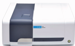
Agilent Cary 60